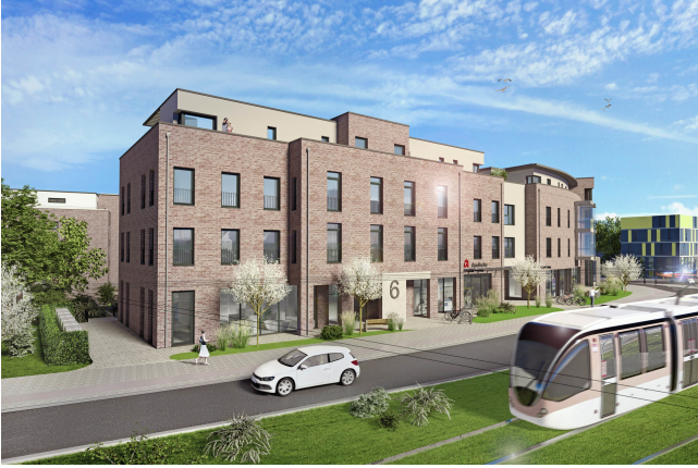
Eingangsbereich Haus 6