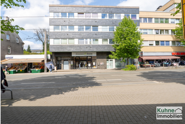
Brackeler Hellweg 136