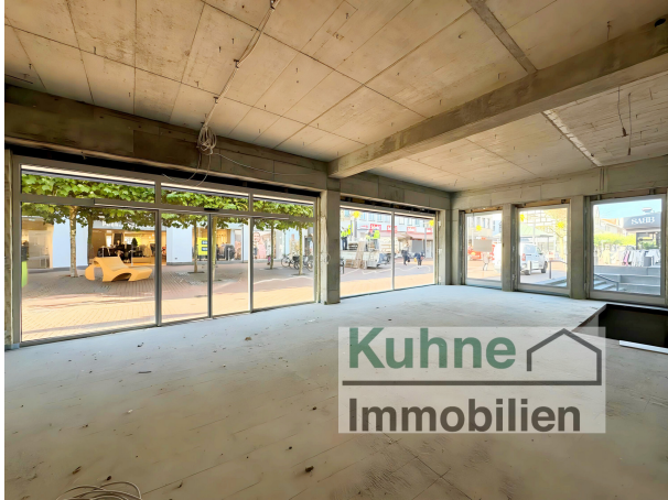
Der Blick aus Ihrem Ladenlokal