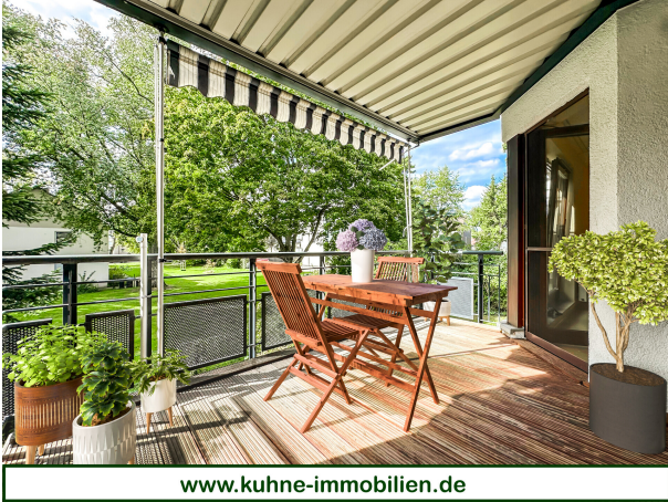
Parkresidenz Lünen 08 - Balkon